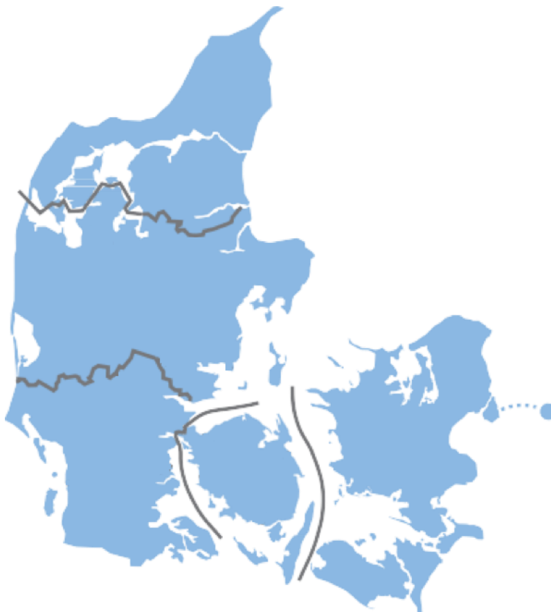
Figur 3: De lokale takstområder i Danmark og Malmø.

Se også http://www.rejsekort.dk/brug-rejsekort/priser-for-rejser/takstomraader-og-taktsaet.aspx